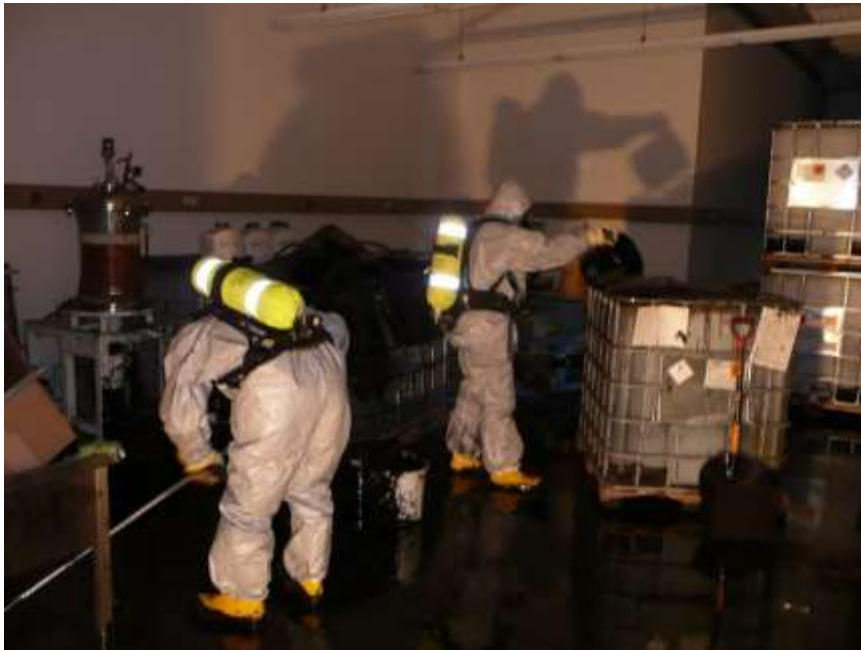
Feuerwehreinsatz am 02.07.2010.

So war dann auch unser erster Firmensitz in Nürnberg die Geburtsstätte der HCC. Die Firma entwickelte sich und wie aus heiterem Himmel kam es am 02.07.2010 zu einem Unglücksfall.